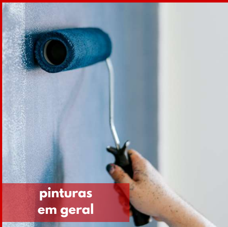
pinturas em geral