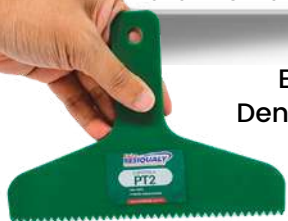
Espátula Dentada (PT2)

Recomendamos usar lâmina dentada de borracha para 2mm (PT2) na aplicação.