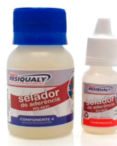
Selador de Aderência