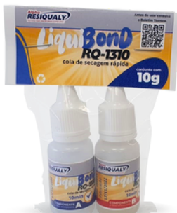
Cola Rápida LiquiBOND