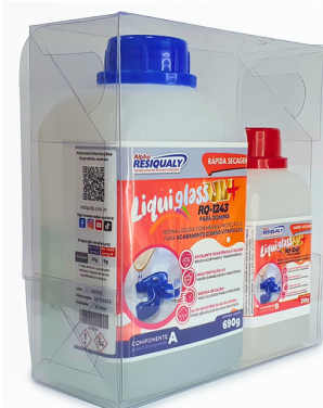
Resina para Doming