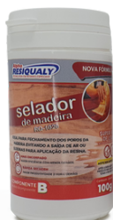
Selador de Madeira