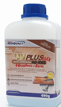
Resina para acabamento