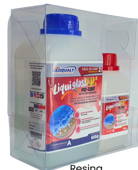
Resina para efeitos