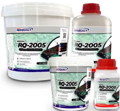
Linha Econômica com média viscosidade.

As resinas para encapsulamento isolam e protegem todo o sistema, sem comprometer o funcionamento!