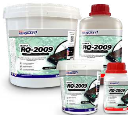
Linha Econômica com secagem rápida.