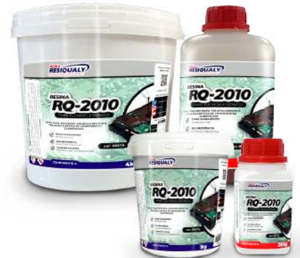
Linha Econômica com alto brilho.